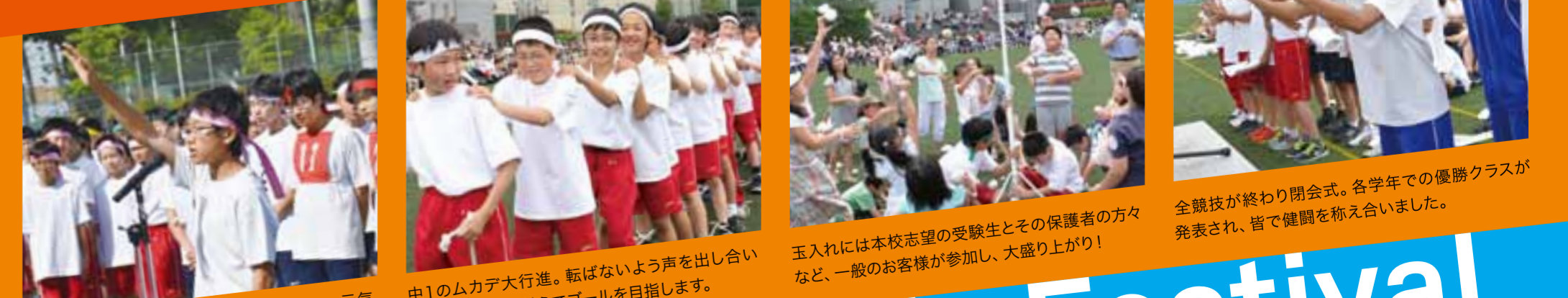
開会式。晴れ渡る青空に負けないくらいに、元気な選手宣誓の声がグラウンドに響き渡りました。