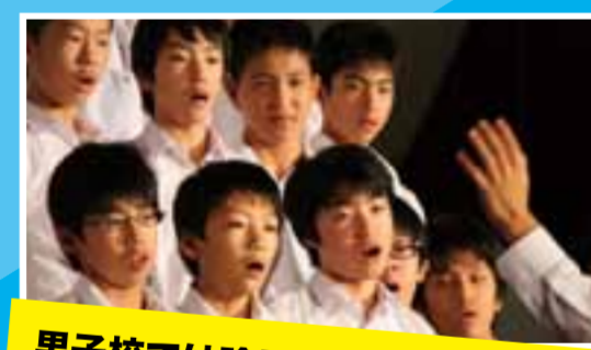
男子校では珍しい合唱コンクール!