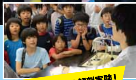
毎年大人気の解剖実験!