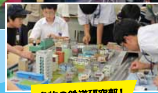
名物の鉄道研究部!