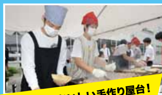
できたてがおいしい手作り屋台!