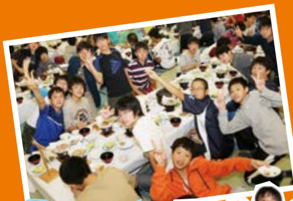
地元岩手の食材に舌鼓をうちました。

9月17日(水)から20日(土)の4日間、岩手県八幡平市で中学2年生の体験旅行が行われました。世界遺産に登録された毛越寺と中尊寺で奥州平泉の歴史に触れたり、農家で体験学習を通じて、普段の生活では得られない貴重な体験をすることができました。