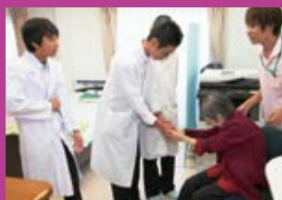
医療法人社団 マイスターアベックスメディカルデンタルクリニック

8月26日(火)、今年度も多くの企業の方々からご協力をいただき、中学3年生が企業研修に行ってきました。社会を支えてくれているその現場を肌で感じた生徒たちは少し緊張した面持ちでしたが、6月に行われたマナー講座の内容などを思い出しながら、しっかりと勉強することができました。