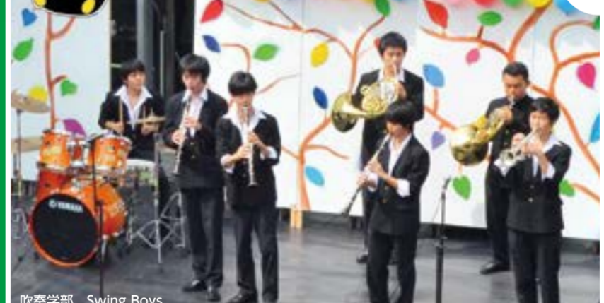
吹奏学部 Swing Boys