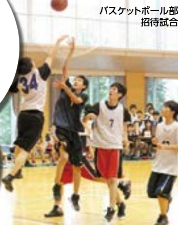
バスケットボール部 招待試合

日々練習に励む運動部の招待試合や紅白戦、現役対OB戦で、運動にも全力で取り組むトシコらしさを見せてくれました。