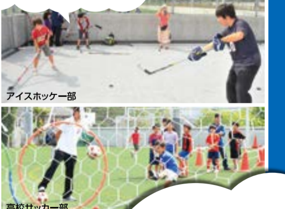
アイスホッケー部