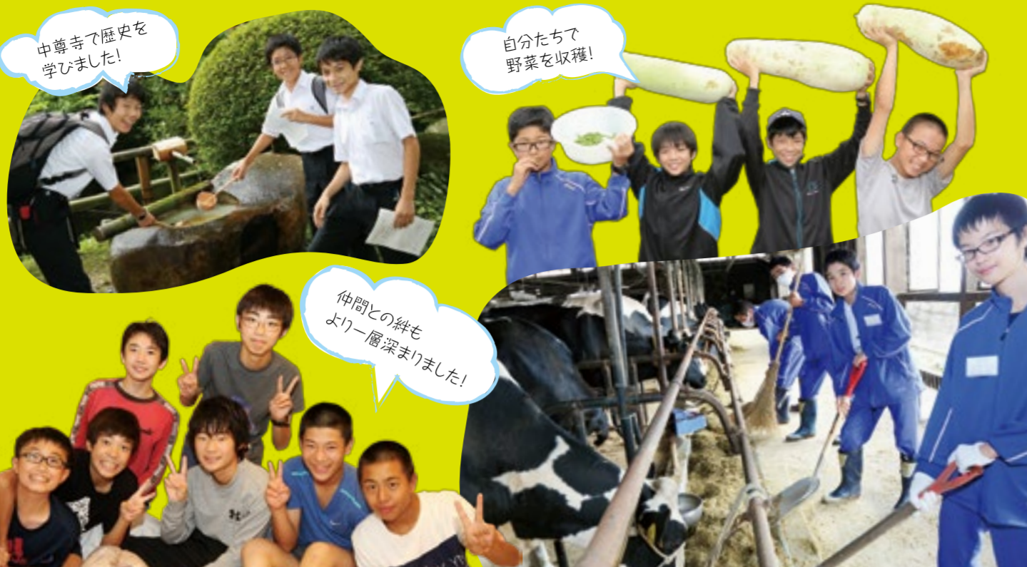
中尊寺で歴史を学びました!

9月9日(水)から12日(土)の3泊4日間、岩手県八幡平市で中学2年生の体験旅行が行われました。世界遺産に登録された中尊寺で奥州平泉の歴史に触れた後は、農家での体験学習。自分で収穫した食べ物の味は格別です。旅行の後半では、東日本大震災の被災者の方よりお話を伺い、防波堤を見学する等、普段の生活では知り得ない大切なことを学べました。