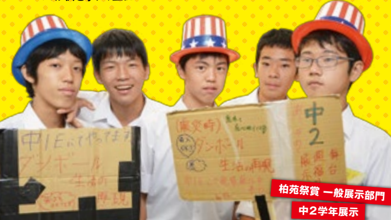
柏苑祭賞 一般展示部門 中2学年展示