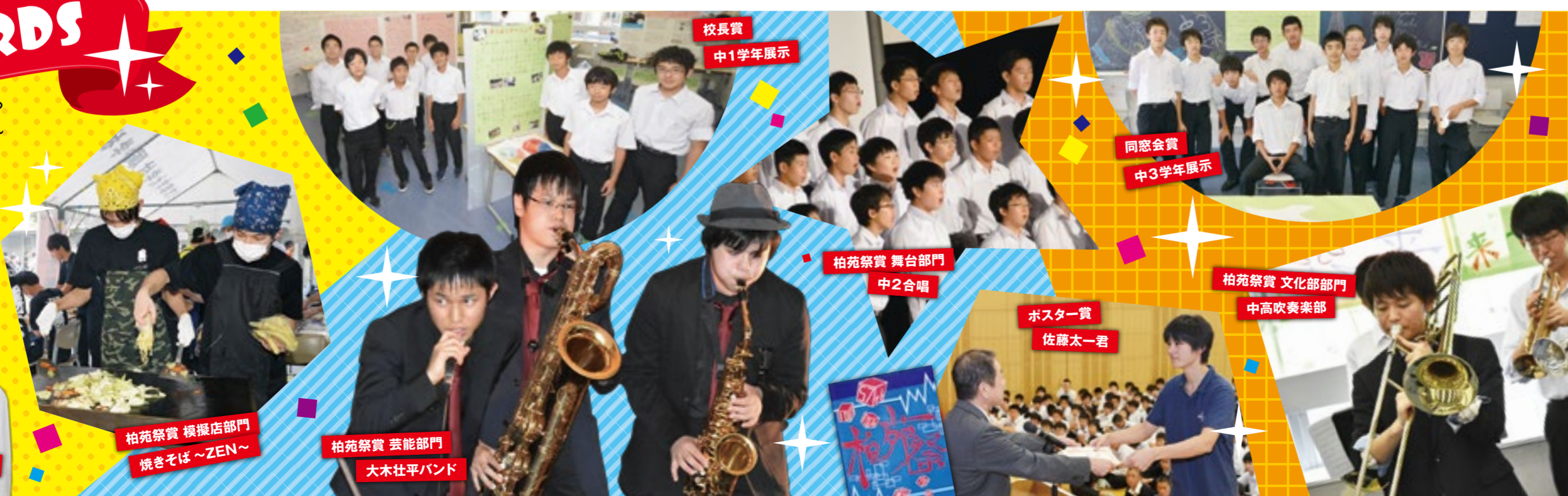
校長賞 中1学年展示