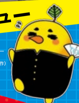
マスコットキャラクター「としこ」 (高3E 中田 隼斗君 作)