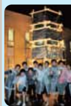
10/9 18:58 雨の中ついに完成! ヤッター! エントランス前で来校者を迎える恒例のモニュメント。今年はエコと美を追求した作品です。高校1年生「美術」授業選択者が作った模型110点の中から選ばれました。