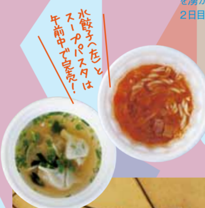
水餃子や、スライム、干物や、お好み焼き

スイングボーイズの演奏や、PTA参加のコーラスをはじめ、Mr.&Missトシココンテストや、クイズ大会など、種数取り混ぜた企画で観客を沸かせたイベントの数々。1日目が雨だった分、2日目は気迫を感じるステージが見られました。