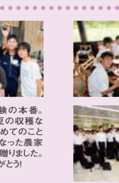
4日目 昼食は小岩井農場でジンギスカン。この旅行でみんな一回り大きくなった?!