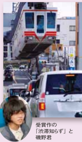
受賞作の「渋滞知らず」と磯野君

「これまで何から何の写真コンテストに挑戦したことはありませんでしたが、このような賞をいただいたことはなかったので、連絡が来たときは驚きました。今後も、公共交通の大切さを表せるような写真が撮りたいいなあ、と思っております。」