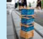
10/7 16:21 制作スタート