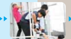
10/8 13:23 力を合わせて組上げていく