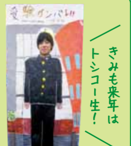
きみも来年はトシコ生!