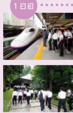
1日目 東北新幹線で、いざ出発。

9月15日より4日間、中2体験旅行が「農(みのり)と輝(ひかり)の大地」岩手県八幡平市にて行われました。豊かな自然環境の中での農業体験をとおして、仲間どうしが語り合い、自然と触れ合い、勤労の尊さや意義を理解し、働くことや創り出すことの喜びを実感しました。