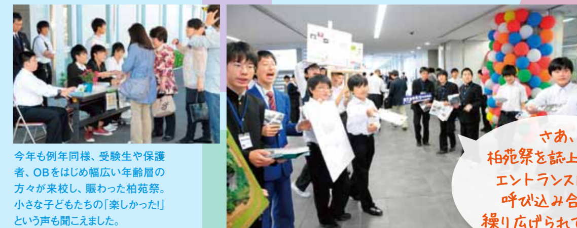
今年も例年同様、受験生や保護者、OBをはじめ幅広い年齢層の方々が来校し、賑わった柏苑祭。小さな子どもたちの「楽しかった!」という声も聞こえました。

さあ、柏苑祭を証し体験! エントランス内では呼び込み合戦が繰り広げられています。