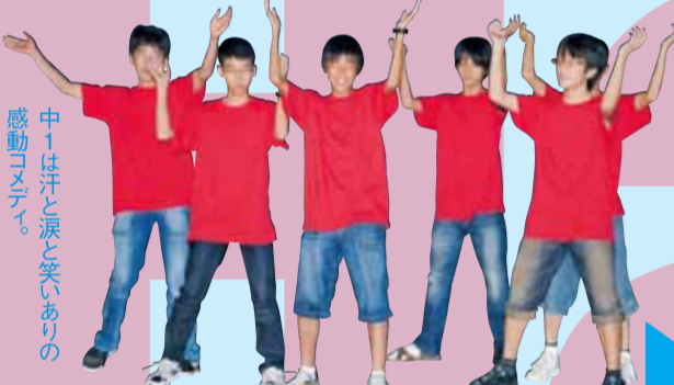
感動の瞬間、中1は汗と涙と笑いあいの