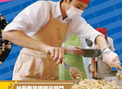
柏苑祭管理部門 焼通職人