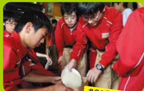
お米の袋詰めを行いました! これがお店に並んでいます。