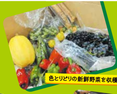
色とりどりの新鮮野菜を収穫しました!