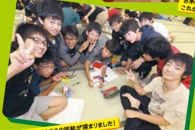
体験旅行でクラスの団結が深まりました!