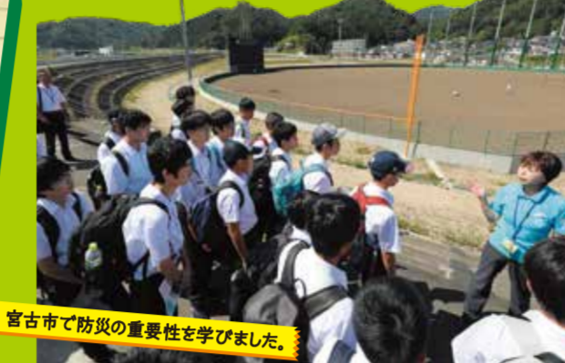
宮古市で防災の重要性を学びました。