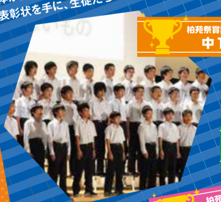
柏苑祭音楽部門 中1合唱