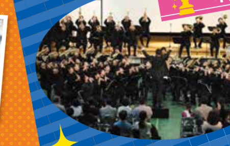
柏苑祭文化部門 中高吹奏楽部