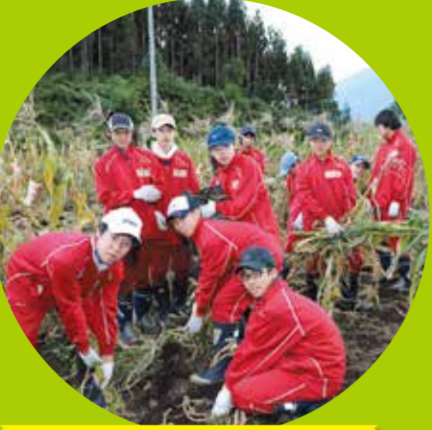
慣れない作業ですが一生懸命行いました!

9月13日(水)からの3泊4日、岩手県で中学2年生の体験旅行が行われました。旅行では八幡平市で農作業を体験。草取りや収穫など、慣れない作業ではありますが農家の皆さんからご指導いただきながら一生懸命作業しました。最終日は震災学習として宮古市を訪れ、津波で4階まで崩壊したホテルを見学しました。農業体験と震災学習を通して生命の尊さや大切さを学びました。