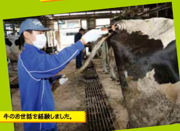
牛のお世話を体験しました。

9月12日(水)から、中学2年生が岩手県で3泊4日の体験旅行をしました。農業体験を通して、勤労の意義や命の大切さ、自然の偉大さを学ぶことが目的です。水稲・畑作・果樹・花き・酪農・畜産などの分野に分かれて、作物の収穫や畑の手入れ、新割りなどを体験しました。他にも、中尊寺や小岩井農場の見学もしました。この旅行を通して学んだことや経験したことを、これからの学校生活に役立てていきましょう。