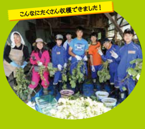
こんなにたくさん収穫できました!