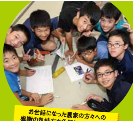
お世話になった農家の方々への感謝の気持ちを色紙にまとめました!