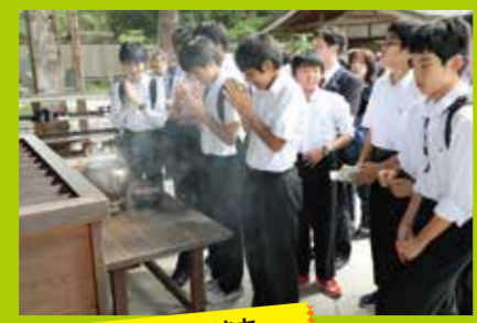
歴史の授業で予習してきた、世界遺産の中尊寺を見学。