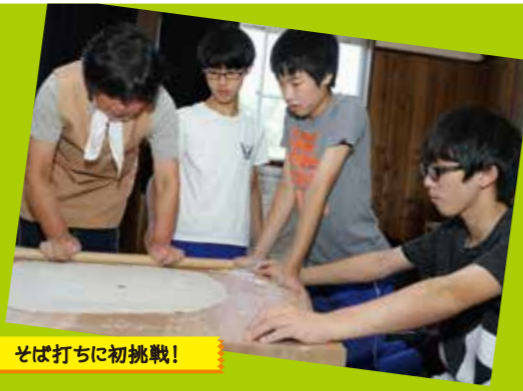
そば打ちに初挑戦!