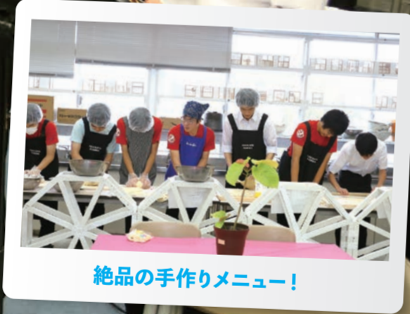
絶品の手作りメニュー!