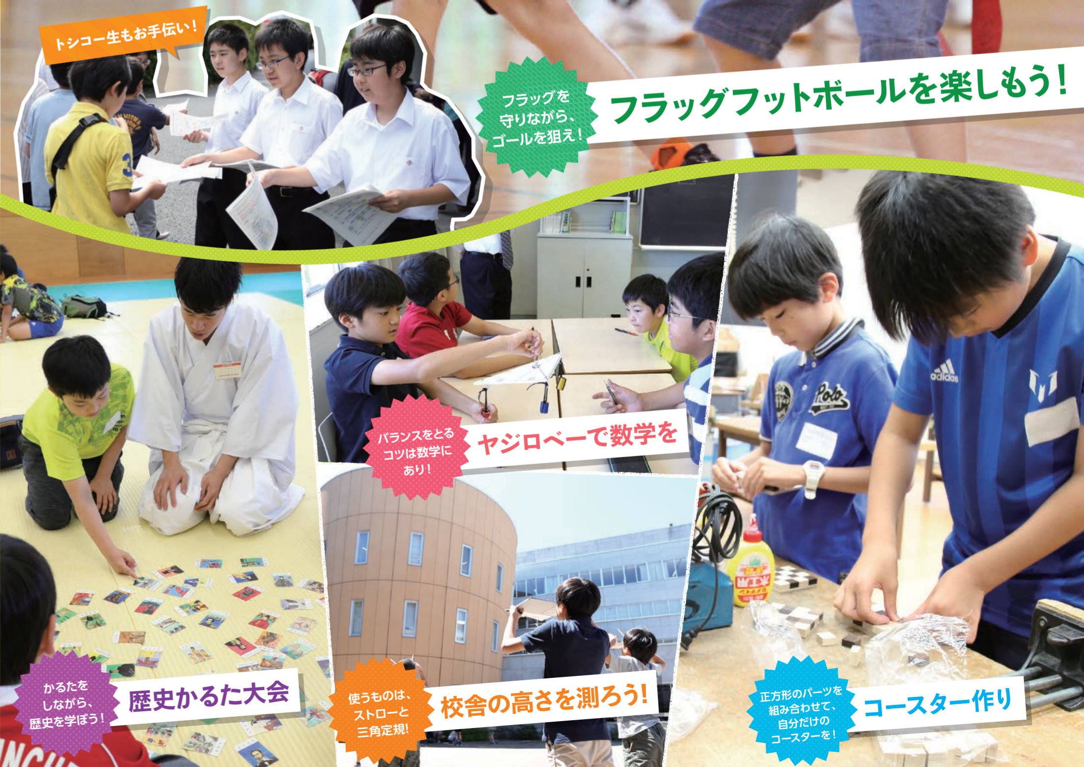
トシコー生もお手伝い!