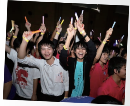
宴夜祭で迎える感動のフィナーレ!