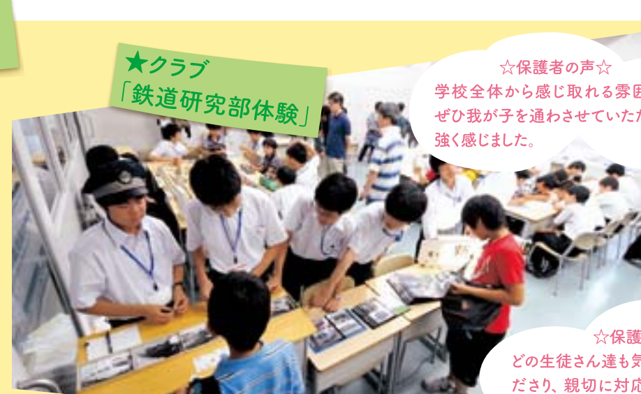
★クラブ 「鉄道研究部体験」

☆保護者の声☆ 学校全体から感じ取れる雰囲気から、ぜひ我が子を通わせていただきたいと強く感じました。