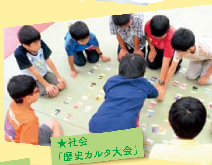
★社会 「歴史カルタ大会」