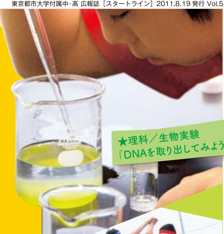
★理科/生物実験 「DNAを取り出してみよう」