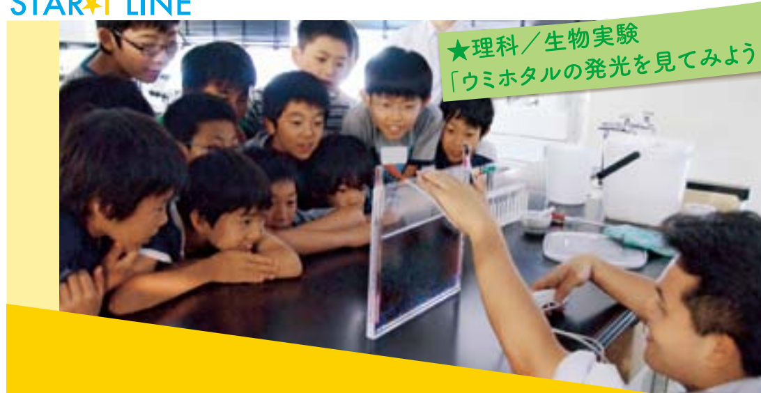
★理科/生物実験 「ウミホタルの発光を見てみよう！」