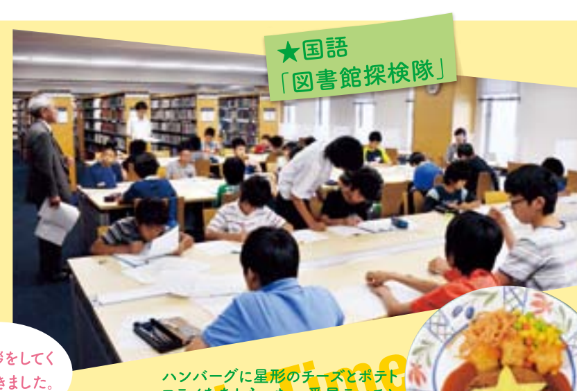
★国語 「図書館探検隊」

☆保護者の声☆ どの生徒さん達も気持ちよく挨拶をしてくださり、親切に対応していただきました。ありがとうございました。