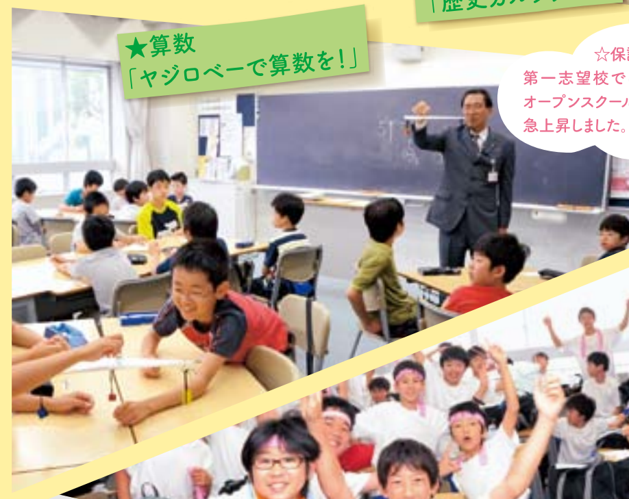
★算数 「ヤジロペーで算数を！」

☆保護者の声☆ 第一志望校ではない…と思いましたが、第一志望校に急上昇しました。