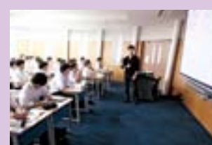
講義の間には笑いもありました。楽しく学ぶ大切なことですね。

7月14日(木)、高1・高2生を対象として学部学科ガイダンスが行われました。この日は14の大学から先生をお招きして、最先端の技術や学問の奥義などについて講義していただきました。どの講義もたいへん興味深いものばかりで、一人ひとりの「一番星」のイメージがより具体的になりました。