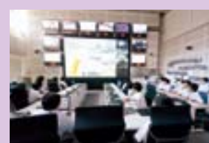
防災センターで研修。東日本大震災のときもここから指令を出しました。

8月1日(月)より、キャリアスタディのハイライトである企業研修が、OBの関連企業で行われ、中3生が約30の班に分かれ全員が参加しました。それらの中から8月4日(木)に訪問した「国土交通省」での研修の様子を報告します。