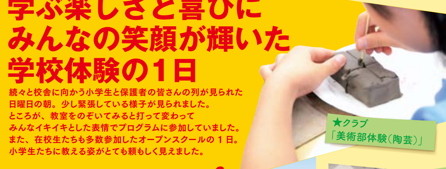
★クラブ 「美術部体験(陶芸)」

ハンバーグに星形のチーズとポテトフライをあしらった一番星ランチと星形トッピング入りの一番星カレー。即完売の人気でした！