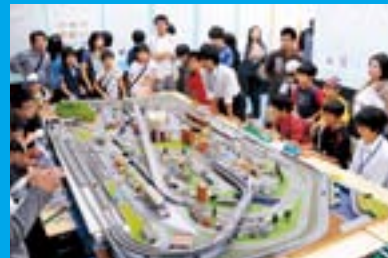
▲鉄道模型レイアウトが見事な鉄道研究部 ▼売り切れ続出の模擬店も本格的!