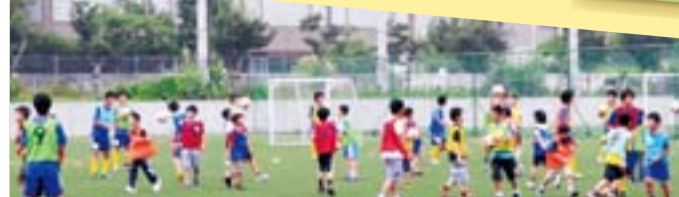
★クラブ 「サッカー部体験」