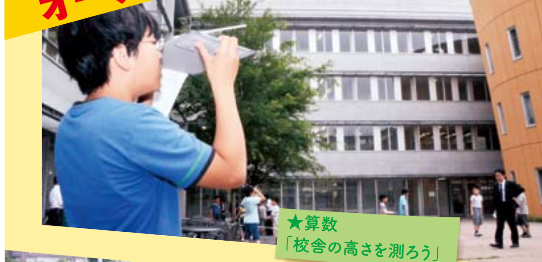
★算数 「校舎の高さを測ろう」