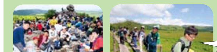
大自然の中で食べる食事は最高!

7月21日(木)朝7時半、中1生全員を乗せたバスは一路蓼科へ向かいました。初日はチームワークを競うオリエンテーリング、2日目は車山の登山、3日目はフラッグフットボール大会で汗を流した後、野外調理を体験。最終日には宿泊した部屋を片付けて、4日間の林間学校が閉校しました。