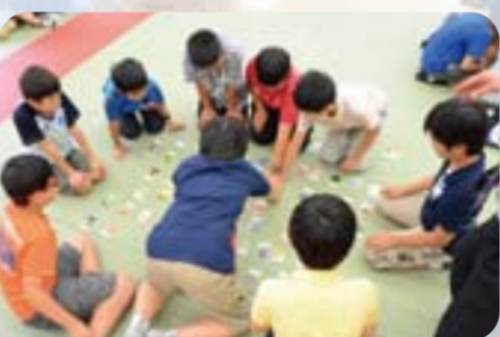
歴史カルタ大会(2011年)

2013年、次の舞台へ挑む都市大付属の全容を明らかにします。 同時開催: 第1回学校説明会(要予約)