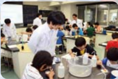
葉脈標本でしおりづくり(2011年)